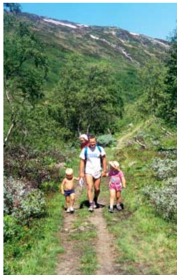
Tur til Austdalen.