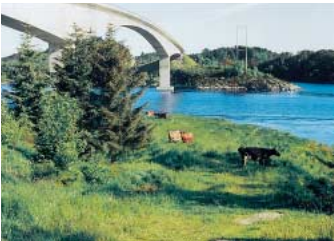
Steinalderstien går under Fosnstraumen.