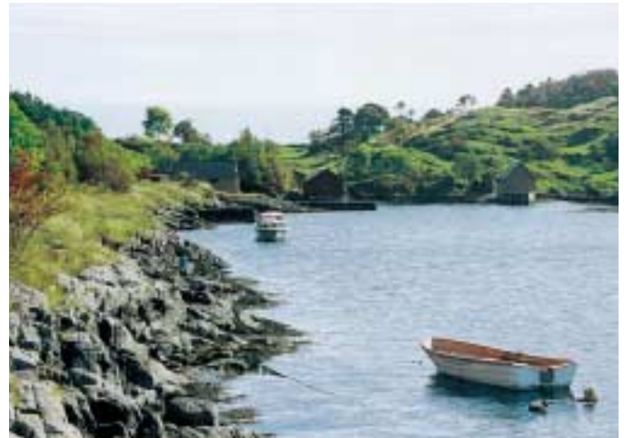
Område på Straume der Steinalderstien går.