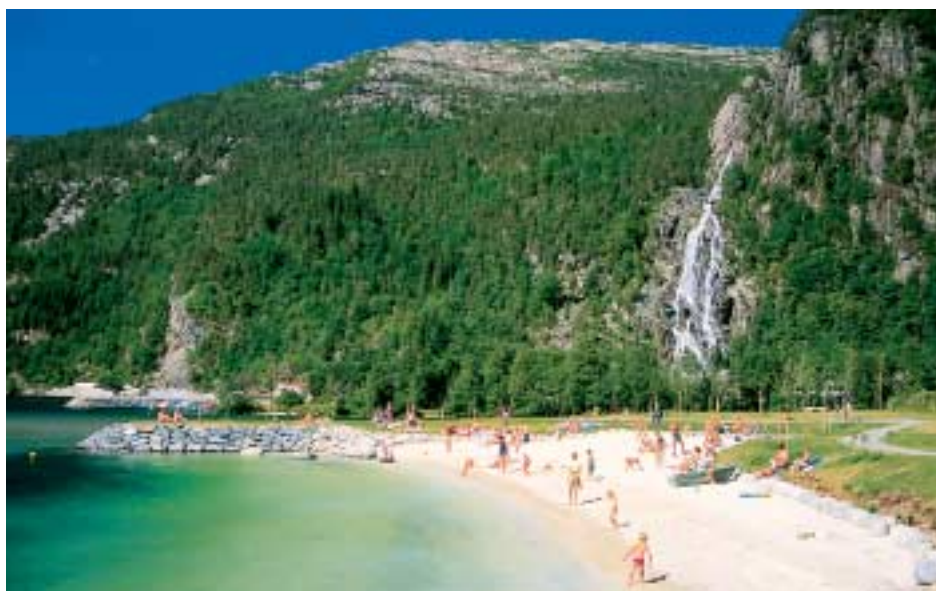
Badestranda på Mo.