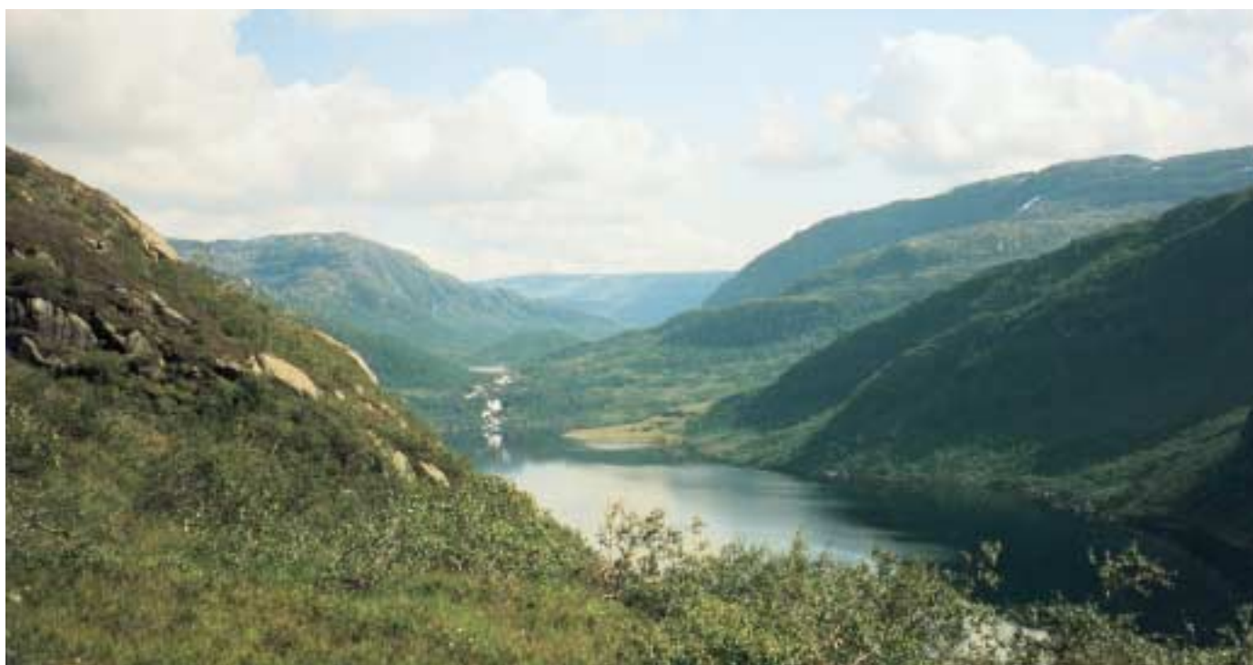
Stølsvatnet mot Åsedalen.