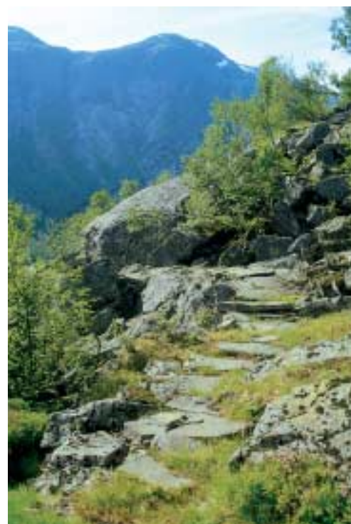
Verkalia i Stølsdalen.